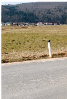
Lepote Dobropolja