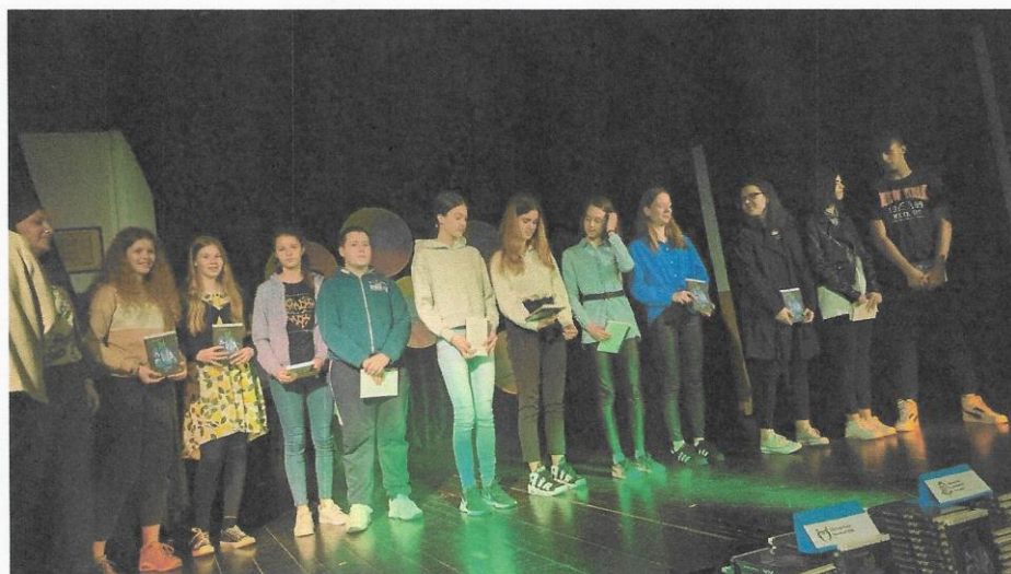
Slika: Naši učenci ob prejemu priznanja za zlato bralno značko na Muljavi, maj 2022