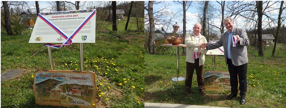
Sliki: Otvoritev Gobarske učne poti Društva gobarjev Štorovke Šentrumar-Hočevje na Vidmu pri Osnovni šoli Dobropolje, 19. aprila 2023 pri osnovni šole Dobropolje na Vidmu