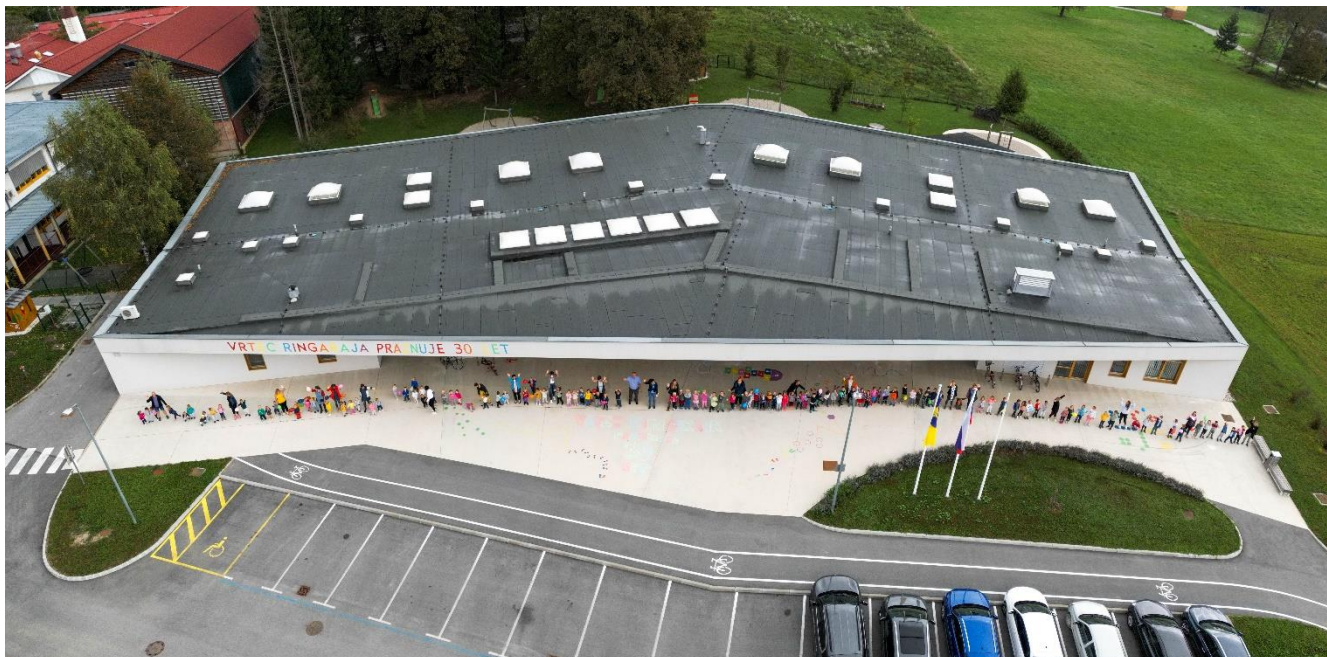
Vrtec praznuje trideset let, september 2023