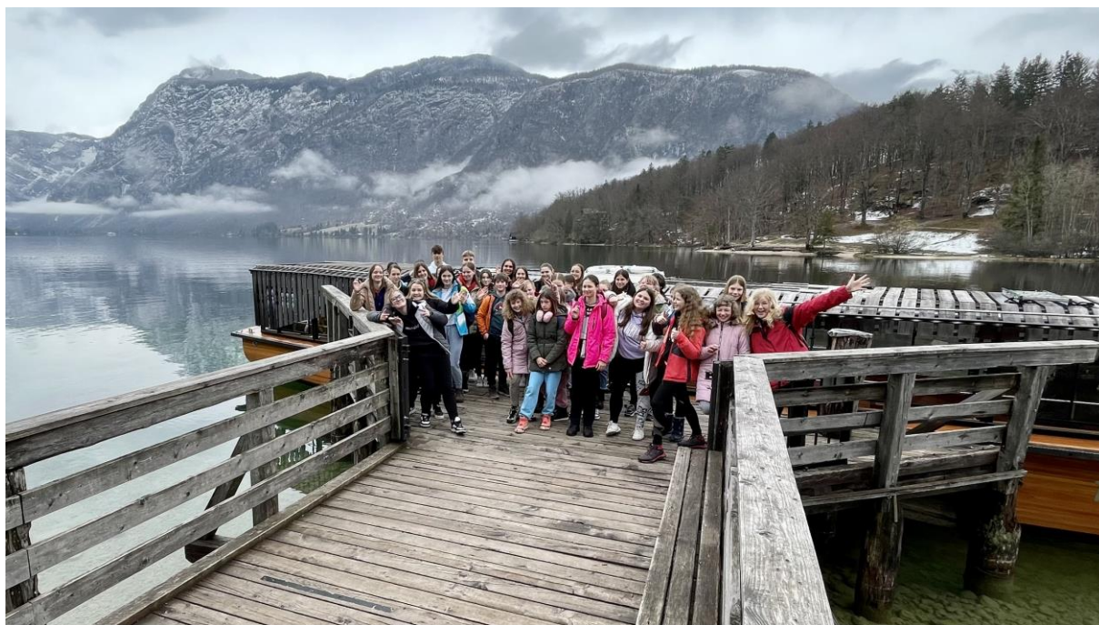
Učenci MPZ in nadarjeni na taboru v CŠOD Bohinj, april 2023