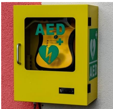
Aparat AED je tudi na športni dvorani, maj 2023

S pomočjo občine bomo za učence 8. in 9. razreda izvedli izobraževanje o uporabi AED defibrilatorja, ki ga imamo na športni dvorani.