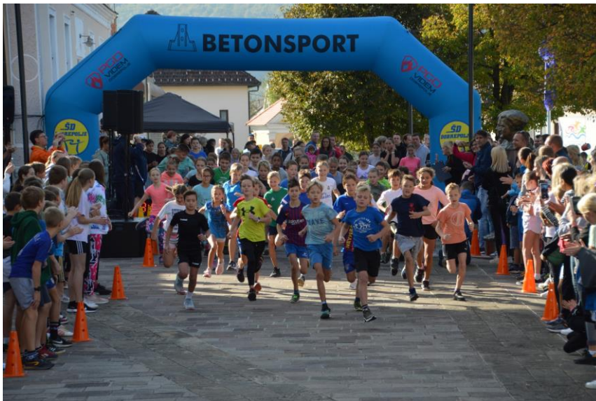
Sodelovanje z ZŠO Dobropolje, oktober 2022

To sodelovanje se bo kazalo v različnih oblikah vzgojno-izobraževalnega dela in povezovanja: