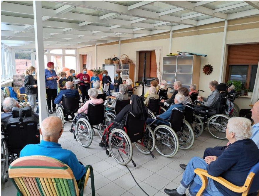
Simbioza – sodelovanje z domom starejših občanov, marec 2023