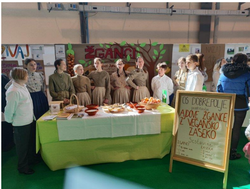
Sejem Altermed, 18. 3. 2023

Celotni vzgojni načrt je predstavljen na spletni strani šole.