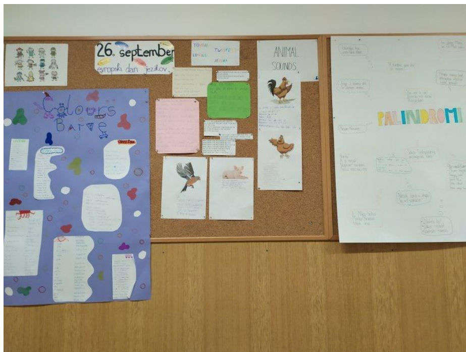
Svetovni dan jezikov, september 2023